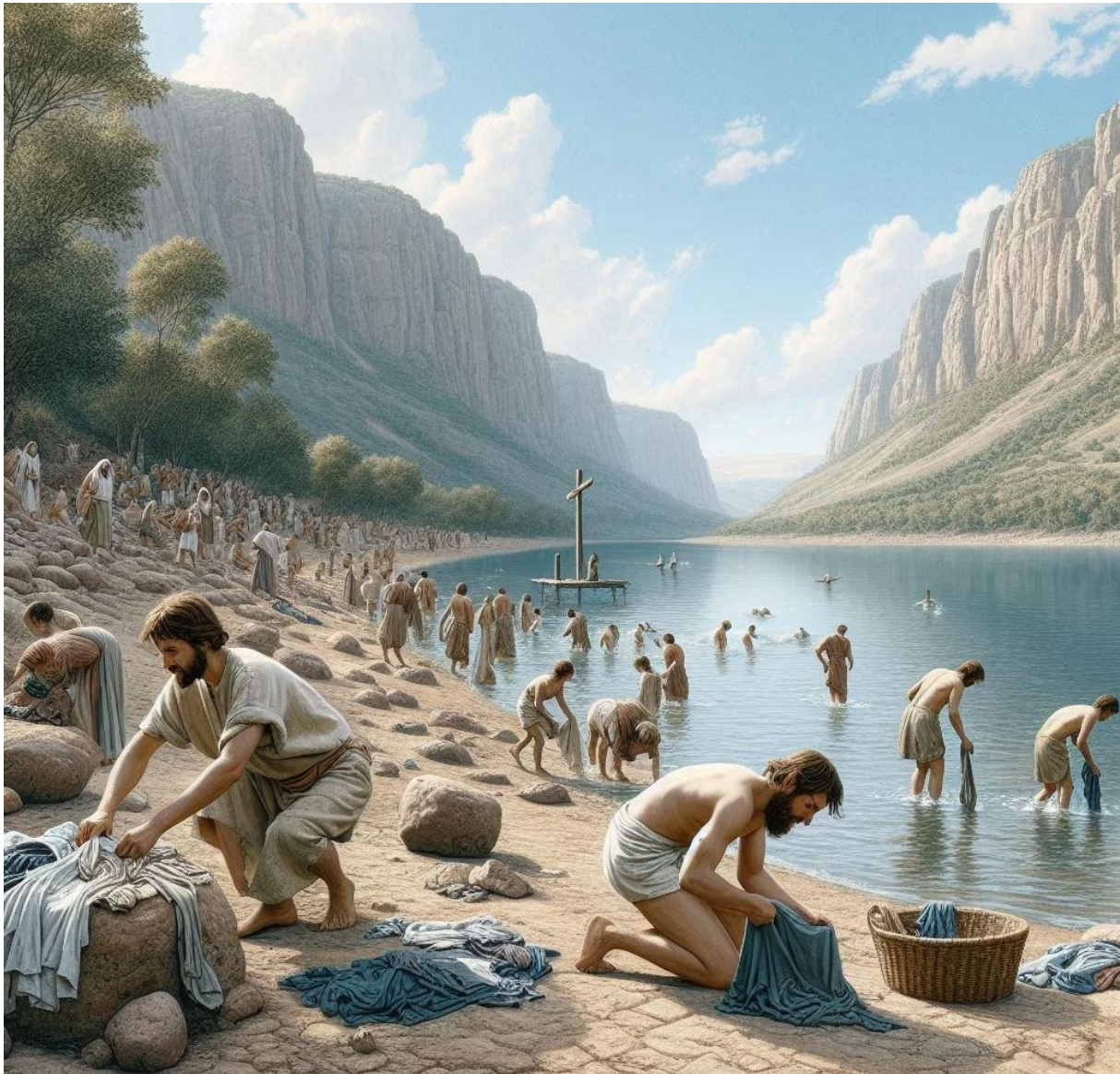
Menschen waschen ihre Kleider im Blut des Lammes rein (Darstellung mit KI generiert)

In Offenbarung 7, 14 wird deutlich: Nur darum, weil sie ausnahmslos ihre von Sünde befleckten Kleider im Blut des Lammes gewaschen und ihre Kleider hell gemacht haben, konnte die in Offenbarung 7, 9-17 beschriebene große Schar geretteter Menschen, die niemand zählen konnte und die aus allen Nationen und Stämmen und Völkern und Sprachen der Erde gekommen ist, vor den Thron Gottes gelangen.